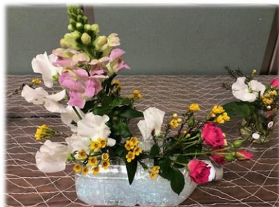
華道部生徒の作品 (生徒昇降口) ペットボトルを利用したア レンジ花を作りました。