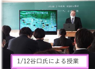
1/12谷口氏による授業

経営や商品開発にまつわる苦労や やりがいや聞き、農業の魅力と可 能性を感じる各特別授業となりま した。