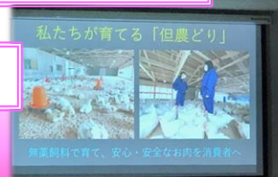
私たちが育てる 「但農どり」