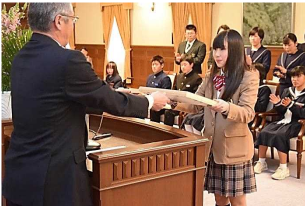
世良田教育次長から表彰状を授与＝兵庫県公館

兵庫県公館において、平成 29 年度第 2 回「ゆずりは賞」表彰式が行われ、受賞者へ表彰状と記念品が贈呈されました。「ゆずりは賞」は県下の学校教育及び社会教育の分野で、多くの人の模範となるような立派な行為等をした個人や団体を教育長が表彰しその功績を讃えるもので、今回は個人 28 名と 2 団体が受賞しました。