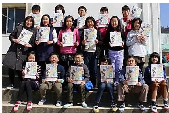
「パンフレット、完成しました！」＝篠山市立西紀小学校

地域創生を持続的に進めるためには、生まれ育った地域に愛着や誇りを持つふるさと意識の高い人材を育成していくことが重要です。そこで、兵庫県丹波県民局と丹波教育事務所の共同事業として、平成28年度から、毎年4校の小学校をクローズアップし、ふるさと学習の成果を広く地域内外に発信し、児童のふるさと意識の醸成と各小学校の活動や