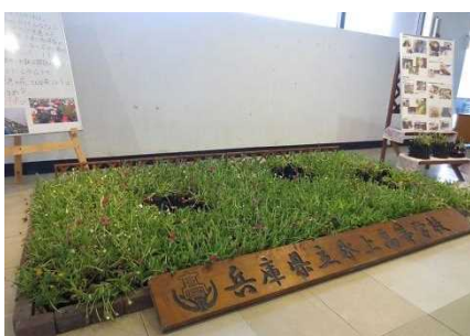
県立氷上高等学校の作品＝兵庫県庁

3 月は、県立氷上高等学校生活科の生徒による作品です。平成 29 年度のラストを飾る作品は、アフリカ原産の花であるリビングストーンデージーを敷き詰め、春を待つ「早春の花畑」を表現しています。