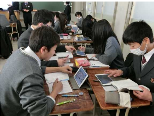
互いのプレゼンテーションについて、 アドバイスを送り合う生徒＝県立明石城西高校

県教育委員会では、平成27年度から3年間、県立明石城西高等学校を研究校に指定し、「ICT利活用実証・研究事業」を進めてきました。この度、これまでの研究成果を広く発信するとともに、生徒の学力向上等を目的としてタブレット端末等の情報機器を活用した教育実践の公開や研究協議を行いました。