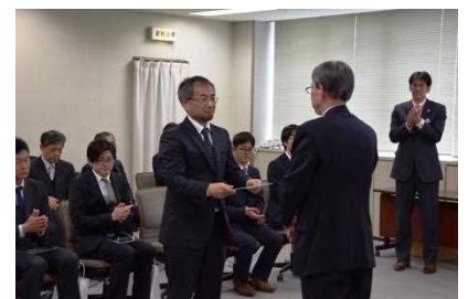
高井教育長から表彰楯を授与