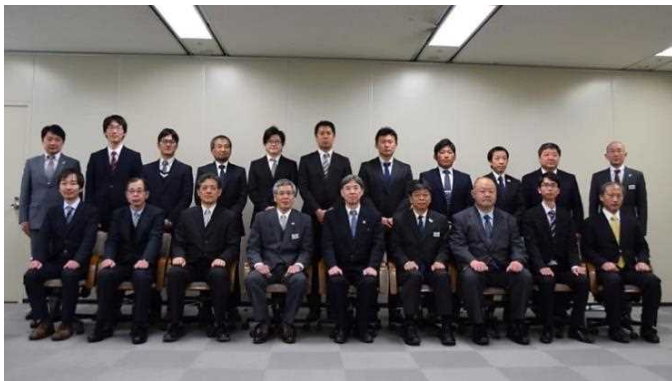
表彰された先生方＝教育委員会室（兵庫県庁 3 号館）