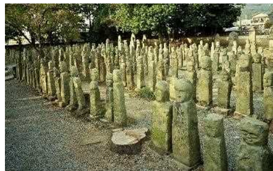
【史跡名勝天然記念物】北条の五百羅漢 ＝加西市北条町