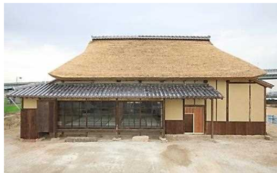
【重要有形文化財】旧小阪家住宅 ＝県立尼崎の森中央緑地内