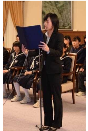
受賞者代表あいさつ