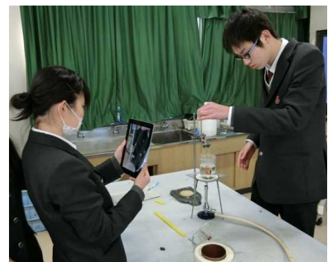
比熱測定の実験の様子を撮影する生徒 ＝県立明石城西高校

当日は、生徒がタブレット端末を用いながら、自分の考えを分かりやすく伝える現代文と英語の授業や、実験手順を確認したり、実験の様子を記録したりする物理の授業など、生徒の主体的な学習活動を中心に据えた取組が公開されました。