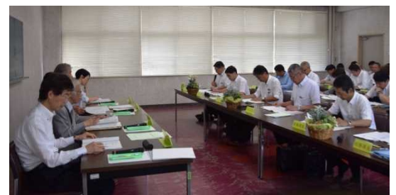
移動教育委員会議の様子＝県立播磨農業高等学校

このほか、今年4月に県立フラワーセンター内に開館した県立考古博物館加西分館「古代鏡展示館」を視察。開催中の開館記念展2「三彩の甕たち 唐王朝のたたずまい」や、同館の収蔵品である貴重な古代鏡の数々を学芸員の説明を受けながら鑑賞しました。