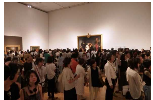
大勢の観覧者で賑わう展示室内の様子=県立美術館

ポール・ドラローシュ 《レディ・ジェーン・グレイの処刑》 1833 年 油彩・カンヴァス ロンドン・ナショナル・ギャラリー Paul Delaroche, The Execution of Lady Jane Grey, © The National Gallery, London. Bequeathed by the Second Lord Cheylesmore, 1902