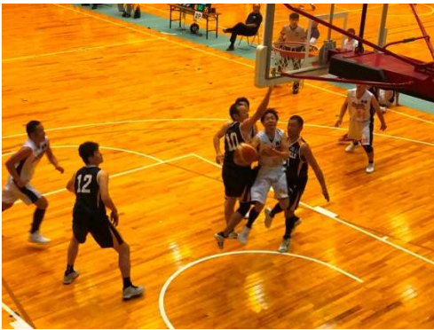
はげしい攻防戦となったバスケットボール競技 兵庫Aチームは見事2位に

スポーツ愛好者の中でも競技志向の高いシニア世代(原則 35 歳以上)を対象としたスポーツの祭典である「日本スポーツマスターズ 2017 兵庫大会」が、全国から大会史上最多となる約 9,000 名の選手の参加により盛大に開催されました。