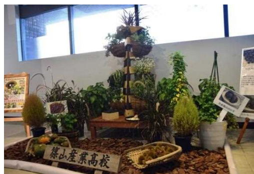
県立篠山産業高校による作品＝兵庫県庁

今回のテーマは「実りの秋 農都篠山」。地元名産の「丹波篠山大黒豆」、「丹波篠山大納言小豆」、「丹波篠山山の芋」など、実際に実習で栽培している生産物が、ガーデニング風にアレンジされた作品です。秋の味覚の代表格であるかぼちゃと栗が「豊穰の秋」の雰囲気演出しています。展示期間は10月末まで。県庁にお越しの際には、ぜひお立ち寄り「秋の味覚」を満喫してください。