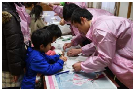
おもしろワークショップ（昨年度） 「よく飛ぶ紙飛行機を作ろう！」