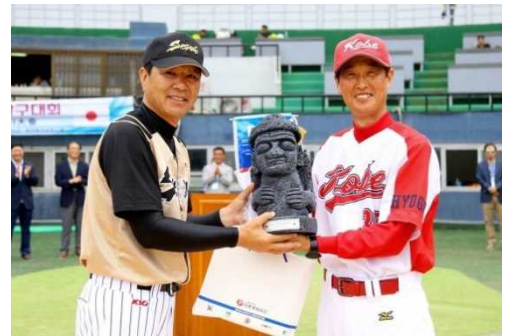
日韓スポーツ交流・成人交歓交流事業として 2012 年から「日本スポーツマスターズ大会」への参加を中心に韓国選手団の受入を実施

本大会は、「スポーツ立県ひょうご」の実現に向けた生涯スポーツの一層の推進、さらには 2021 年に関西一円で開催される 4 年に一度の生涯スポーツの国際総合競技大会である「ワールドマスターズゲームズ 2021 関西」に向けた機運醸成の機会にもなりました。