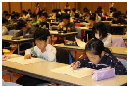
「チャレンジQ」に挑戦！（昨年度）