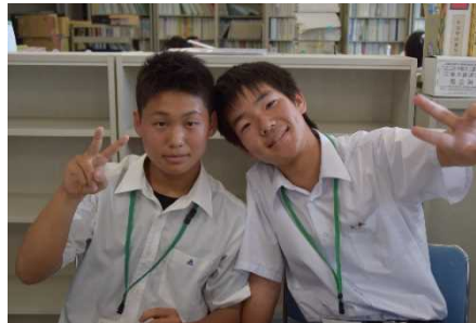
初めて会って数時間とは思えないほど 仲良しです！ (学事課)