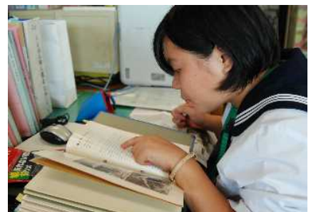
入力の間違いを一生懸命探します。 (文化財課)