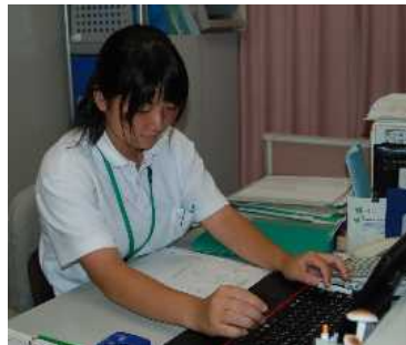
教育長のスケジュールを作っています。 (総務課)