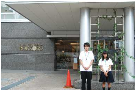
ここでお客様をお迎えます。 (六甲荘)

高校生が県の仕事を体験する「県庁インターンシップ」が8月22日から5日間実施され、知事部局関係に19名、県教育委員会関係に57名、県警察本部に40名の生徒がインターンシップに参加しました。総務課インターンシップ生が取材した教育委員会事務局等でインターンシップを行った24名の感想と仕事の様子を紹介します。