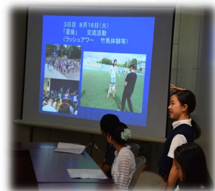
スクリーンを使って活動報告する様子

ひょうご・ロシアハバロフスク青少年少女交流事業の一環として、中学1年生から高校1年生のスクール生12名が8月14日から8日間、ロシア・ハバロフスクを訪れ、地元の青少年と歌やスポーツで交流したり、ホームステイを通じて生活文化を体験したりしました。8月25日には、参加したスクール生12名による帰国報告会が県庁で行われました。