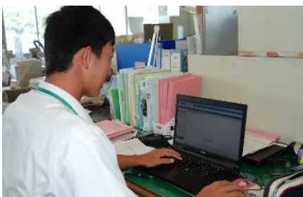
慣れないパソコンでの作業は大変です。 (高校教育課)