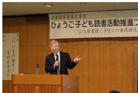
昨年の地区フォーラムの様子

県内の子ども読書活動の活性化を目指し、県内5地区でのフォーラムと全県フォーラムを開催します。今年度のテーマは「地域をつなぐコーディネーターによる読書コミュニティ拠点の形成」。県民の参加を広く呼びかけ、講演やトークセッション等をとおして、子ども読書活動の持続可能な体制づくりを進めます。またビブリオバトル甲子園を開催し読書活動につながる機会を提供します。