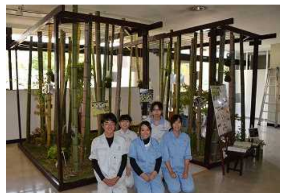
篠山東雲高校の作品展示

9月は県立篠山東雲高校地域農業科ふるさと特産類型の生徒による作品展示です。大きな竹林の中にはハーブや花のミニガーデンがあり、ちょっとした散策ができます。また、学校生活の1年の流れが写真にて展示され、四季の移り変わりを感じることができます。じょうろや霧吹きが備え付けてありますので、県庁にお越しの際は気軽に水やりもしながらお楽しみください。展示場所は県庁2号館と3号館の間の通路（議会棟1階）です。