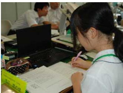
沢山のアンケートを集計しています。 (人権教育課)