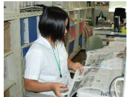
新聞の記事を一つ一つチェックします。 (スポーツ振興課)