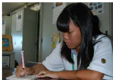
相手の話したことを素早くまとめます。 (総務課)