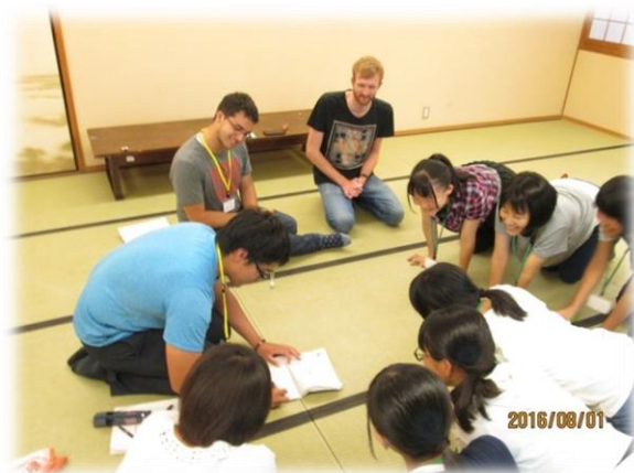
ALTとのレクリエーション

生徒達は、最初は緊張した面持ちでしたが、宿泊生活をともにすることで、徐々に周りの生徒やALTと打ち解け、充実した4日間を過ごすことができました。皆、スプリング・キャンプでの再会を楽しみにしていました。