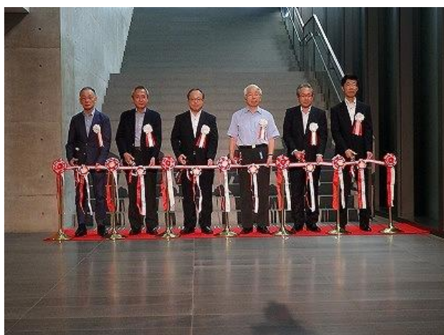
特別展「生誕 130 年記念藤田嗣治展」開会式の様子