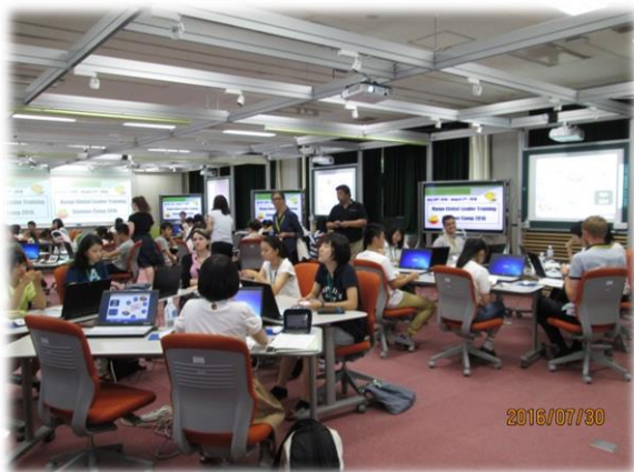
ICT機器を活用した全体ワークショップ (県立教育研修所 演習室)

県立高校2年生47人が参加し、ひょうごグローバル・リーダー育成キャンプが県立教育研修所で行われました。今年で2回目の開催です。ALT（外国語指導助手）20人が加わり、3泊4日の宿泊生活を通じて、彼らから「生きた英語」を学ぶとともに、論理的思考力や表現力の向上をめざしました。今年も、5人の生徒と2人のALTが一つのグループとなり、教育研修所の教育情報棟で最新のICT機器を活用しながら、ワークショップを行いました。