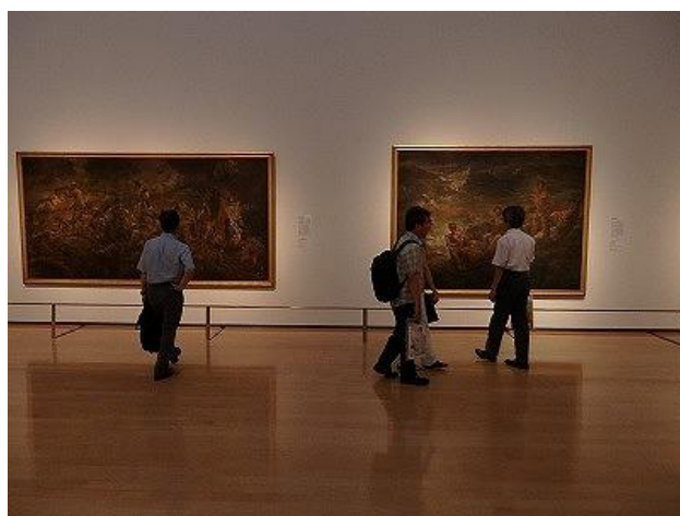
特別展「生誕 130 年記念藤田嗣治展」内覧会の様子