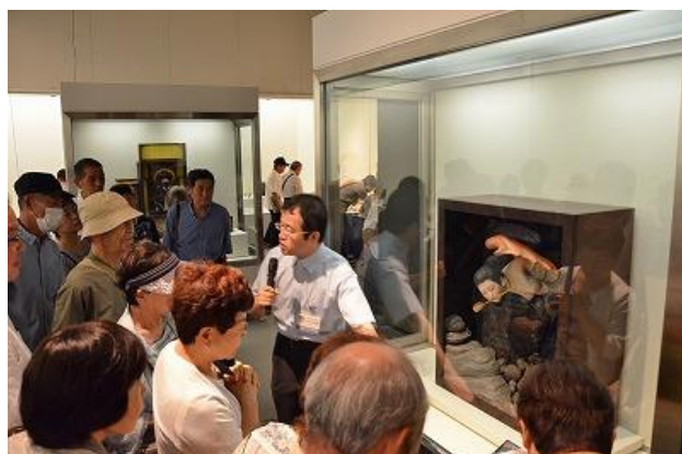
特別展「立体妖怪図鑑」学芸員の解説を熱心に聞く来館者（県立歴史博物館）