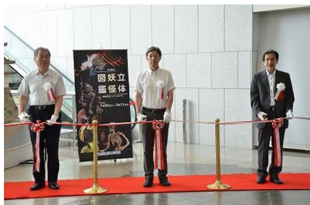
特別展「立体妖怪図鑑」開会式の様子