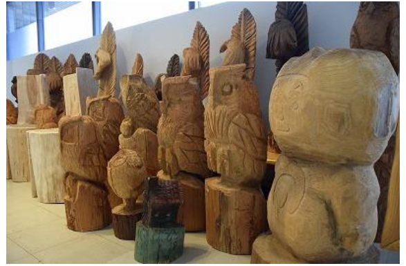
山崎高校の作品展示

作品からは木の温かみを感じられ、音楽隊が今にも動き出しそうです。中央の丸太の椅子は、杉の株元の部分を切り出し、釘やビス等を使わず素材をそのまま生かして仕上げられています。県庁にお越しの際はぜひ椅子に座って写真撮影などお楽しみください。展示場所は県庁2号館と3号館の間の通路（議会棟1階）です。 ※学校PR等は ワンショットニュース で発信しています。