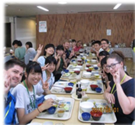
全て英語で楽しい食事タイム