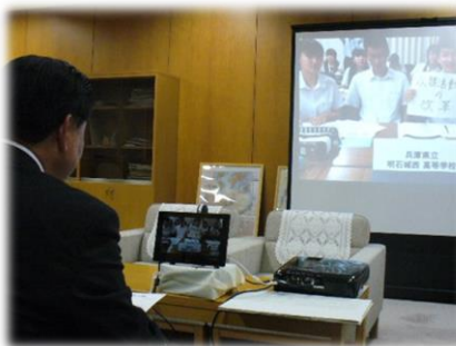
インターネットテレビ電話を通じて高校生の質問に答える県会議員＝県議会