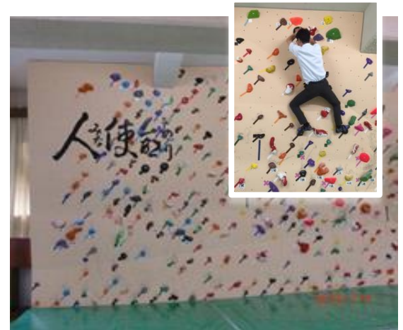
完成したボルダリングウォールは本格的な技術が習得できる。初チャレンジする財務課職員。＝村岡高校

ボルダリングは、東京オリンピックの追加種目になる可能性がとても高いそうです。但馬から、未来のオリンピック選手が誕生することを期待したいですね。