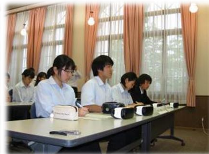
ネット回線で県議会と中継をつなぎ、インタビューする生徒たち＝三田祥雲館高校