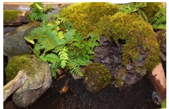
香住高校作品展示