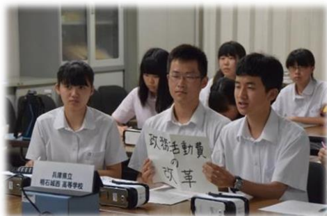
紙に書いた質問や提言を見せ、県会議員と議論する生徒たち＝明石城西高校

選挙権年齢が満18才以上に引き下げられることを受け、ICTを活用して高校生が政治や議会について学ぶ取り組みが県議会などで行われました。県議会前議長、県立明石城西高校2年生、県立三田祥雲館高校2、3年生がインターネットテレビ電話をつなぎ、選挙運動や政治について熱心に討論を行いました。今後、両校の生徒は補足取材・学習に取り組み、成果をタブレット端末を活用しながら新聞にまとめる予定です。