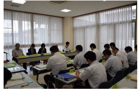
移動教育委員会の様子＝淡路三原高校

第6回定例教育委員会が淡路地区（県立淡路三原高校）で開催されました。同校の概要説明の後、多くの傍聴者が見守る中、定例教育委員会が開催され、審議等が行われました。教育委員会閉会后、教育委員は生徒と意見交換をしたり、淡路人形の伝承に取り組む郷土部による淡路人形浄瑠璃を観劇したほか、南あわじ市立福良小学校を訪れ、施設見学や授業視察を行いました。