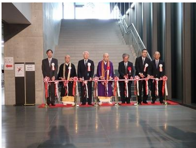
「生誕180年記念富岡鉄斎-近代への架け橋-展」開会式の様子