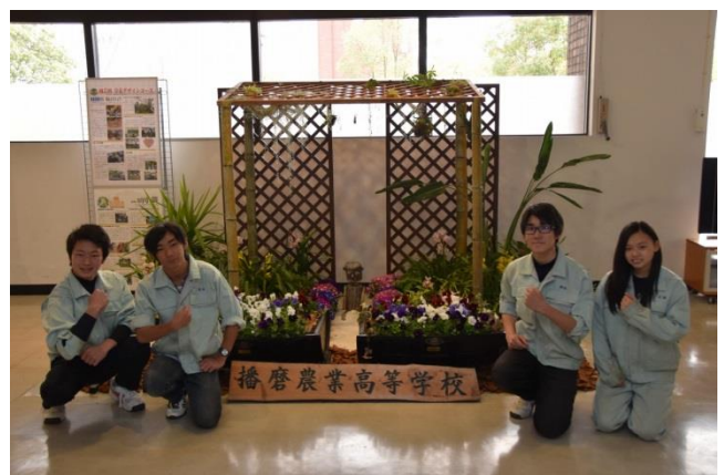
播磨農業高校の展示

4 月は、県立播磨農業高校園芸科草花デザインコースガーデニング班の 3 年生 4 人による作品です。作品タイトルは「播農発、私たちの明るい未来行き」。タイトルどおり、春らしく明るい展示になっています。倉庫にあった大樽や廃材を活用して「フラワートレイン」をテーマに路線と貨車を創り、パンジー、サイネリア、シンビジウムなどを飾りつけました。駅舎の中にたたずんでいるのはガーデニング班に代々伝わる「モックん」だそうです。県庁にお越しの際はぜひお立ち寄りください。展示場所は県庁 2 号館と 3 号館の間の通路議会棟 1 階です。