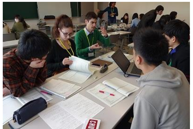
スプリング・キャンプの様子(淡路青少年交流の家)

県立高校 2 年生 89 名が ALT との活動・宿泊生活などを通じて「生きた英語」を学ぶとともに、論理的思考力や表現力の向上に取り組み、将来、世界で活躍できるグローバル・リーダーを育成するため、7 月に実施した「サマー・キャンプ」に引き続き、「スプリング・キャンプ」を淡路青少年交流の家で実施しました。サマー・キャンプで生徒が各グループで設定した課題について研究計画を立て、それぞれの研究成果を班でまとめたものを、この度のスプリング・キャンプでプレゼンテーションを行いました。ALT と協力して目標を達成でき、生徒達は充実した表情でキャンプを終えました。