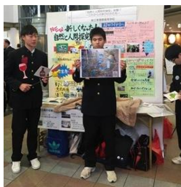
ポスターセッションの様子