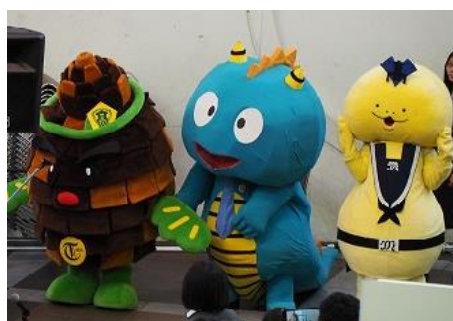
高校のマスコットも参加