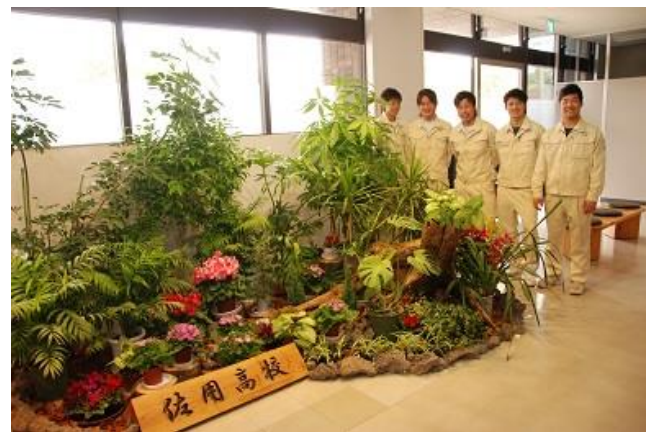
佐用高校の作品展示

2月は佐用高校農業科学科2年生5人による作品です。自分たちで育てたシクラメン、サイネリアなどを、ジャングル風の作品に仕上げました。水やりや温室の温度調整など、学科全体で育てたものです。佐用高校の活動を紹介したパネルも展示していますので、ぜひお立ち寄りください。展示場所は県庁2号館と3号館の間の通路(議会棟1階)です。