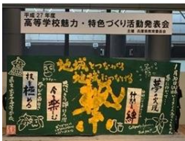
出石高校の書道部、美術部によるステージ発表

この活動発表会は生徒達が運営に携わりました。御影高等学校生徒会と放送部が司会や案内係、チラシと缶バッジのデザインは龍野北高校、缶バッジの制作は赤穂高校(定時制)、発表内容のホームページづくりは兵庫工業高校が担当しました。会場にはいない生徒を含め、たくさんの方々の力を合わせての発表会となりました。