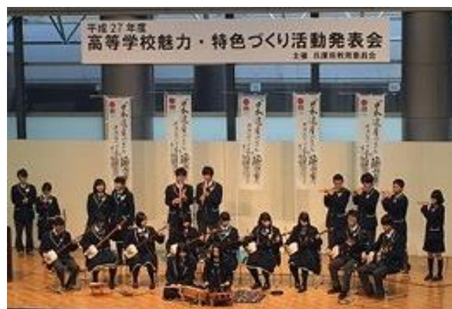
篠山鳳鳴高校デカンショバンドによるステージ発表