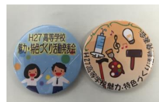
生徒によりデザイン制作された缶バッジ

http://www.hyogo-c.ed.jp/~koko-bo/index.html