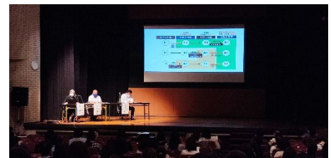
7月13日 学校説明会 西宮市勤労会館の様子