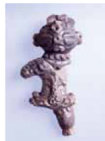
遮光器土偶(辰馬考古資料館蔵)

開催日 全日程 開催時間 10:00~17:00 料金 大人1,000円・大学700円・高校500円・小中学生 無料 定員 なし 開催場所 姫路市本町68 兵庫県立歴史博物館 問い合わせ先 兵庫県立歴史博物館 TEL 079-288-9011 URL: http://www.hyogo-c.ed.jp/~rekihaku-bo