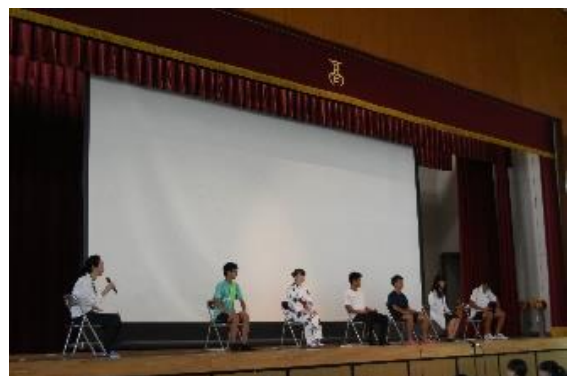
「パネルディスカッション」