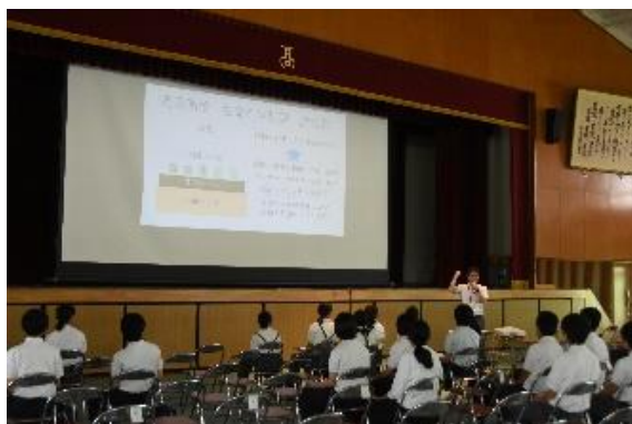
「探究学習について」