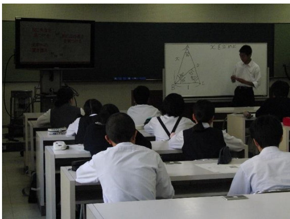
「授業体験」(数学) *星陵生による授業