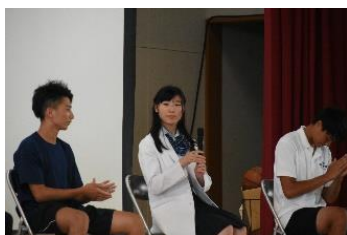
2年生は、探究活動やクラスの様子について話しました