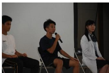
「パネルディスカッション」