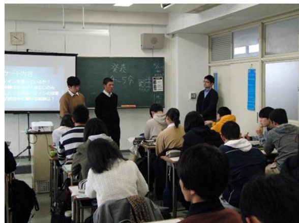
質疑応答では鋭い質問も…