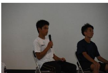
1年生は星陵高校進学を決めた理由や高校受験について話しました