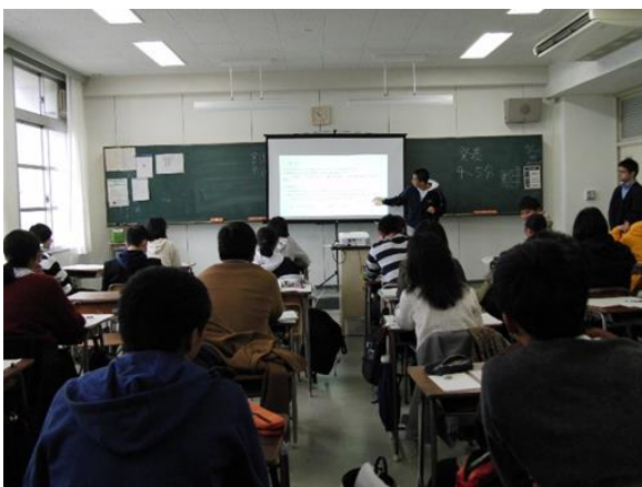
星陵では2年生全員が「探究」の発表をします