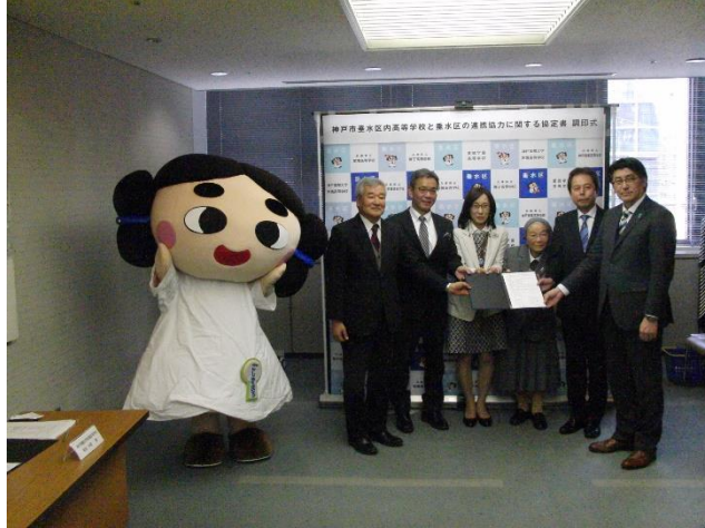
垂水区内高等学校と垂水区の連携協定締結(2019.3)

探究基礎(1年生) 「垂水区の現状と課題について」垂水区まちづくり課 担当者: 6/14(金)