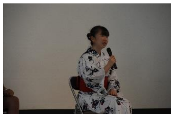
「パネルディスカッション」