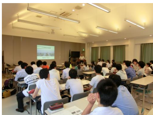
講義を聴いている生命科学類型の生徒