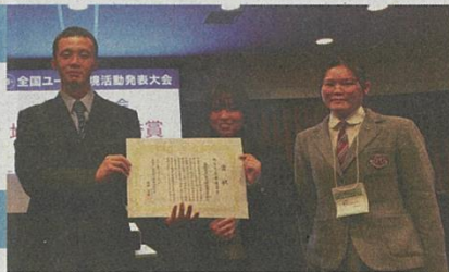
高校生エシカル推進委員会