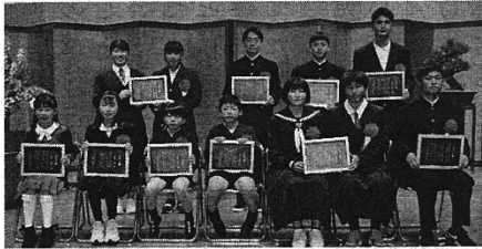
みどり賞を受賞した小中学生