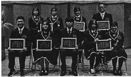
みどり賞を受賞した高校生・一般

を拠点に活動 俳句の普及 羅の代表としても芸術文 発展に寄与 市文化協会役 員や丹波文化団体協議会理 事などを長年務め、コーラ スクール「ドレミファ紗 の部」で特に優れた作品を書