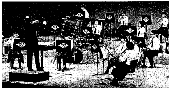
重厚感のある音色を響かせた篠山産業高校の吹奏楽部