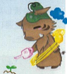
こまるいの (篠山東雲高校マスコット)