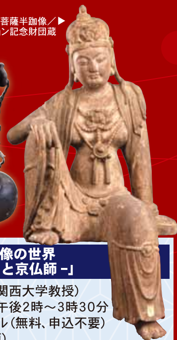
観音菩薩半跏像／ 広岡コレクション記念財団蔵 ▶