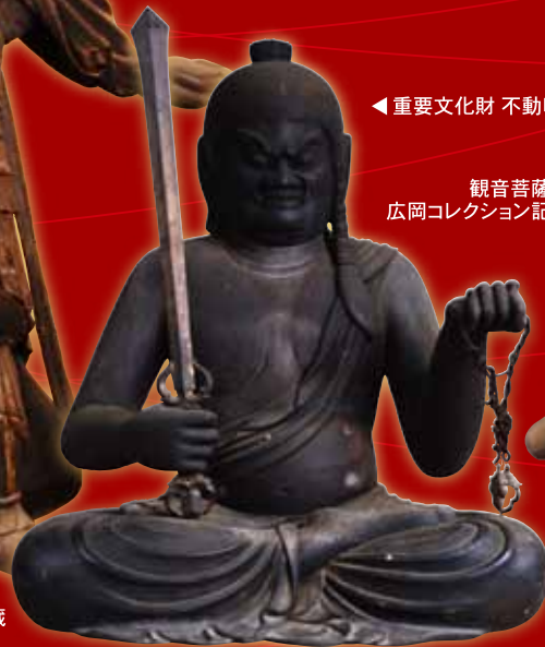
◀重要文化財 不動明王坐像／瑠璃寺蔵