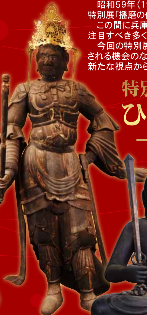
▲重文 毘沙門天立像／随願寺蔵