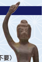
誕生釈迦仏立像／應聖寺蔵▲