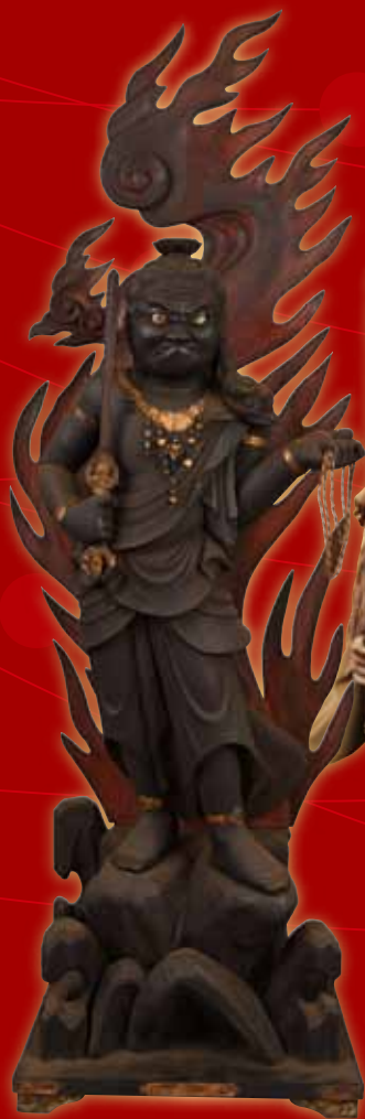
▲不動明王立像／性海寺福智院蔵