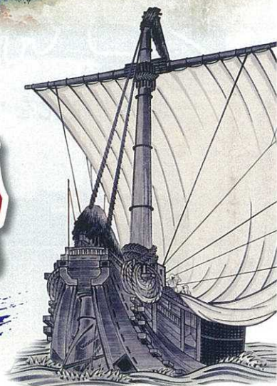
引札 羽前加茂港秋野与四郎(部分) 明治29年(1896) 兵庫・豊岡市(住吉屋歴史資料館)蔵

◇休館日 / 毎週月曜日 ※ただし、9月21日(月・祝)、10月12日(月・祝)は開館、9月24日(木)、10月13日(火)は休館