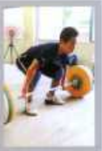
ウエイトリフティング部