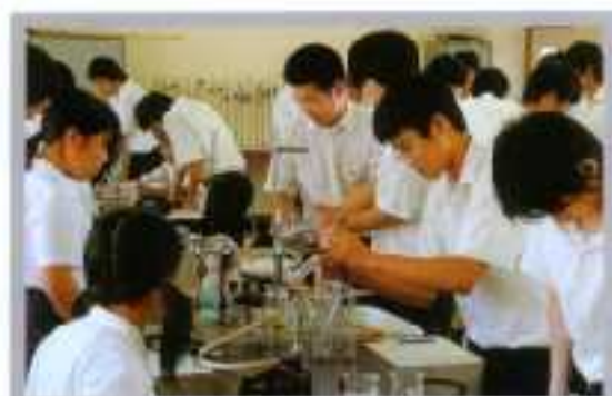
自然科学コース授業風景