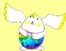
テラたま (イメージキャラクター)