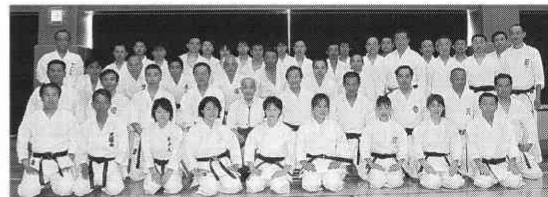
講習会終了後の記念撮影

The participants had such a productive day. Through this seminar, they could hear Genro Tsujikawa's valuable words and practice kata.