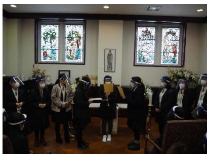
▲British Wedding (Lesson)

1つ目の Lesson です。グループに分かれて、様々なプログラムを体験しました。その後、自由時間を取りました。