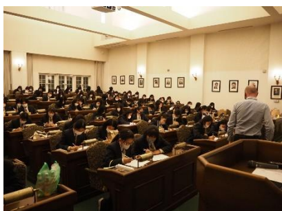
▲テーブルマナーレッスン

ブリティッシュヒルズ内での動きは、生徒それぞれ異なりましたが、All English で互いにコミュニケーションを取りながら、ルールを守り、よく行動していました。