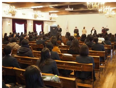
▲ブリティッシュヒルズの Teacher による講評