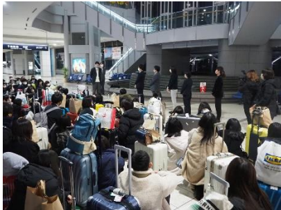
▲生徒代表による謝辞（解散式）

この国内研修を通して得た知識や経験、チャレンジ精神は、生徒たちの今後の高校生活や進路実現に向けて、大きな力になると確信しています。