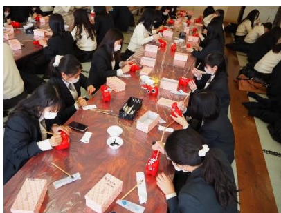
▲絵付け体験の様子

仙台ヒルズホテルから福島県に移動し、鶴ヶ城会館で赤べこ・起き上がり小法師の絵付け体験等、日本の伝統工芸に触れました。かなりユニークな作品も多く、楽しい体験でした。その後、会津地方の郷土料理「わっぱ飯」をいただきました。自由行動では、鶴ヶ城を見学するなど、有意義な時間を過ごしました。