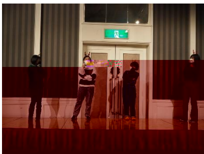
▲有志生徒による出し物

仙台ヒルズホテルに到着し、本日の最終イベントである年次レクリエーションを行いました。有志の生徒による出し物、企画係によるクイズ大会など、大いに盛り上がりました！