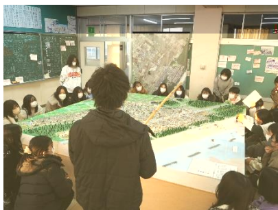
▲現地スタッフによる説明

仙台市立荒浜小学校で震災学習、及び慰霊碑での黙祷を行いました。当時の災害について肌で感じることができました。