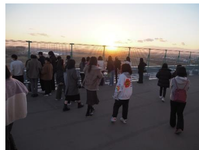
▲屋上から見る被害の様子