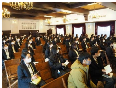
▲オリエンテーション