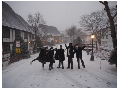
▲朝に雪の中を散歩