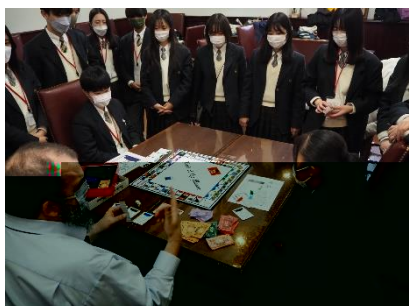
▲Lord of the Manor (Lesson)

2つ目、3つめの Lesson です。生徒たち皆、それぞれのプログラムを心から楽しんでいる様子でした。