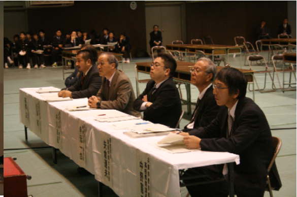
審査委員（質疑応答）