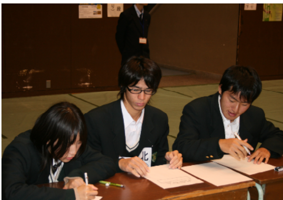
予選（筆記競技）団体戦