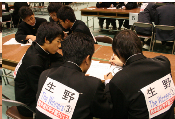
リベンジマッチ 予選で敗退したチームによる3択問題での勝ち残り戦