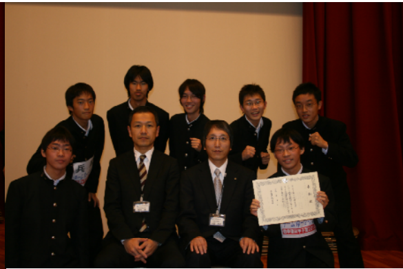
準優勝 県立兵庫高等学校