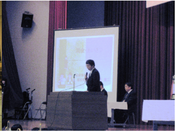
開会式 中野高校教育課長 挨拶