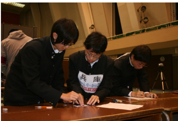
本選（実技競技）数学分野 「9マスの枠にオセロを用いて、ルールに従ってオセロの白と黒の置き方を調べる。」