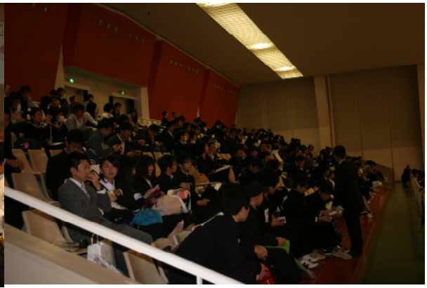
観覧席からの応援