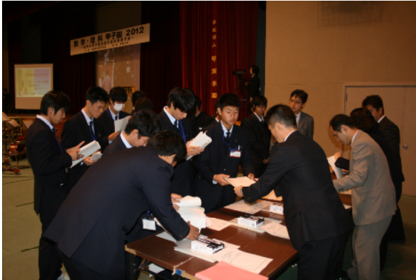
生徒ボランティアスタッフ