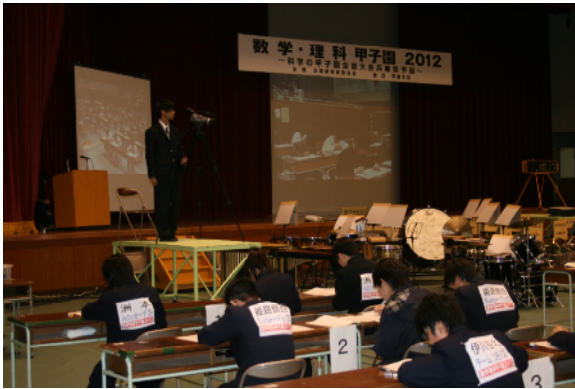
予選（筆記競技）個人戦