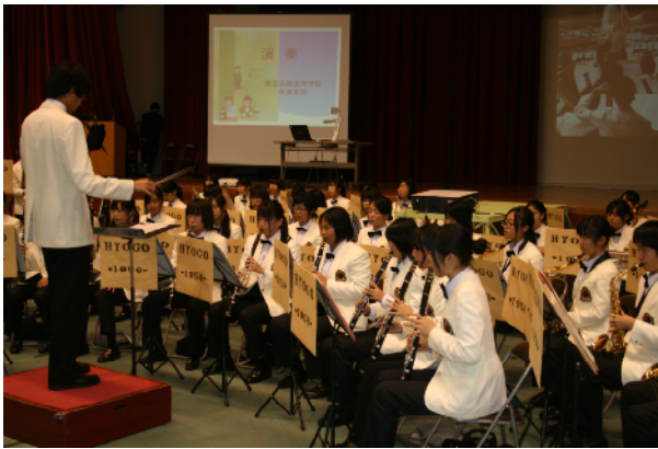
演奏 県立兵庫高等学校吹奏楽部