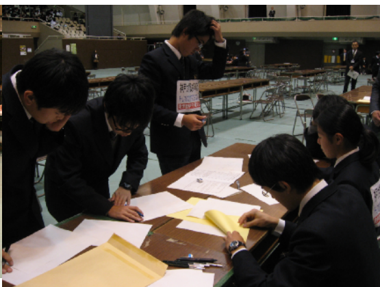
決勝（実技競技） 「A4、B4判の紙を、より少なく折って82.5°を作り、プレゼンテーションする。」