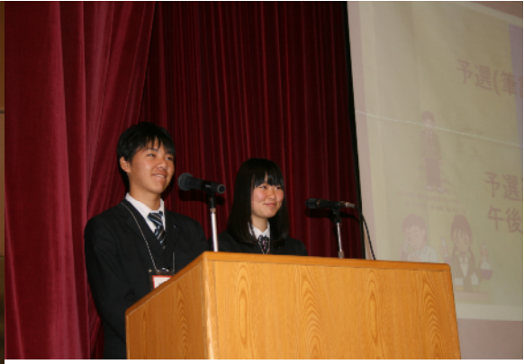
司会 龍野北高等学校放送部