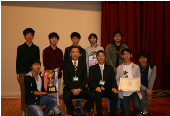
優 勝 灘高等学校