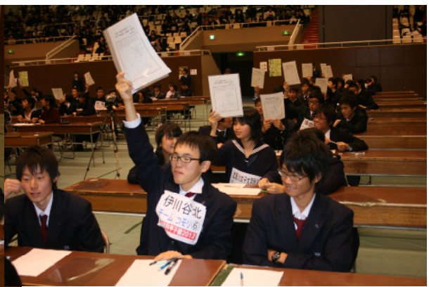
予選（筆記競技）団体戦