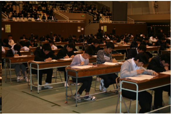
予選（筆記競技）個人戦