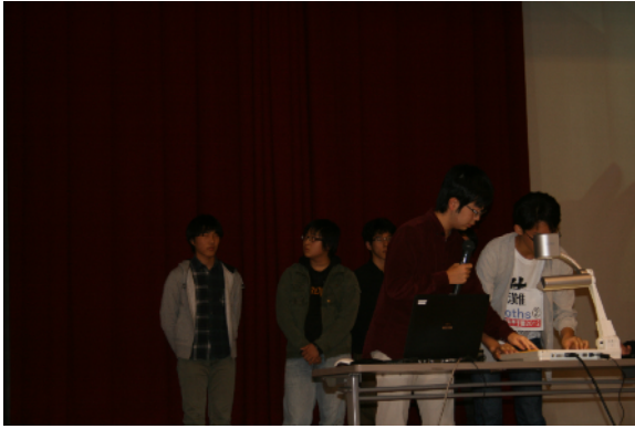
決勝（実技競技）プレゼンテーション