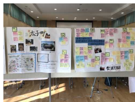
生徒によるまとめ②