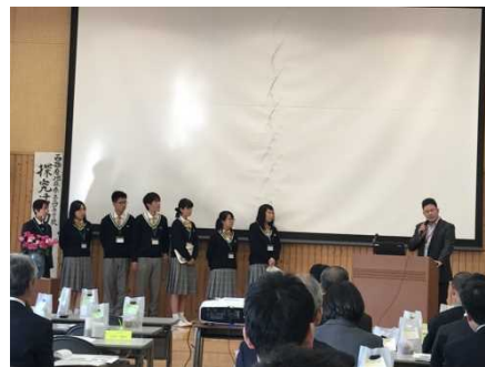
大学教員による講評