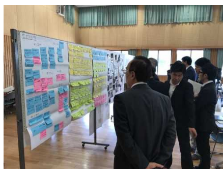
生徒によるまとめ①