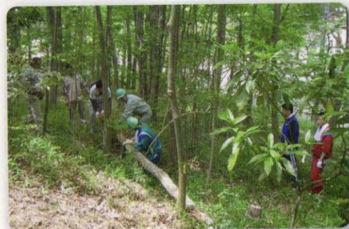
北高校生と森の手入れ

この森は昭和40年代に神戸市が里山を住宅地として開発造成した集合住宅、戸建住宅が混成している住宅街の中心部にある1ha程の森です。隣接している運動公園林全体が「からと公園林を楽しむ会」の活動地です。子供たちが安全に通学で