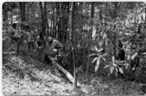
北高生と森の手入れ

この森は昭和40年代に神戸市が里山を住宅地として開発造成した集合住宅、戸建住宅が混成している住宅街の中心部にある1ha程の森です。隣接している運動公園林全体が「からと公園林を楽しむ会」の活動地です。子供たちが安全に通学で