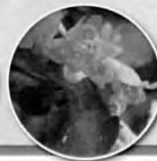
アリマウマノスズクサ〈左〉 ササユリ〈中〉 コツクバネウツギ〈右〉

みどり滴る林間に芳しい香りが漂い、森の妖精とも言われるササユリが咲き始めたようです。里山放置林の手入れを始めて3年目にササユリが2輪咲き、毎年3輪、5輪と増え今年は20輪花を付け住宅街の中心部の森をコアジサイとともに彩っています。手入れ後に確認された林床植物はチゴユリ・ギンラン・アリマウマノスズクサ・オカトラノオ・ツルニンジン・ハンショウツル・コウヤボウキ、樹木では高木を除去したので光が入ったためかウグイスカグラ・ヤブムラサキ・マユミなどが花を付け実を付けています。薪炭林として利用されていた頃はササユリなどが咲き乱れる植生豊かな里山だったようです。