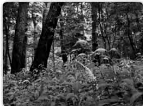
林内に咲くオカトラノオ

私たちが続けてきたボランティア活動が、地域のみなさんの憩いの森になり、子どもたちが安心して遊べる、また、身近な生き物の観察が出来る森になるよう手入れを続けていきたいものです。