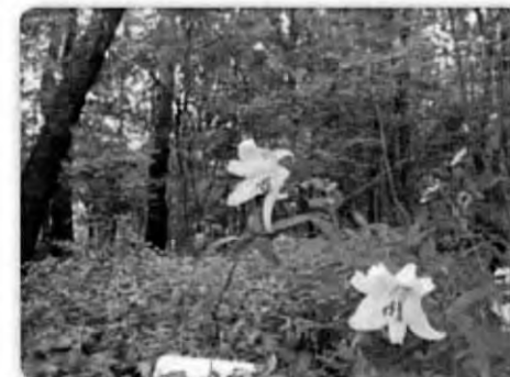
林内に咲くササユリ