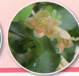
アリマウマノスズクサ〈左〉 ササユリ〈中〉 コックパネウツギ〈右〉