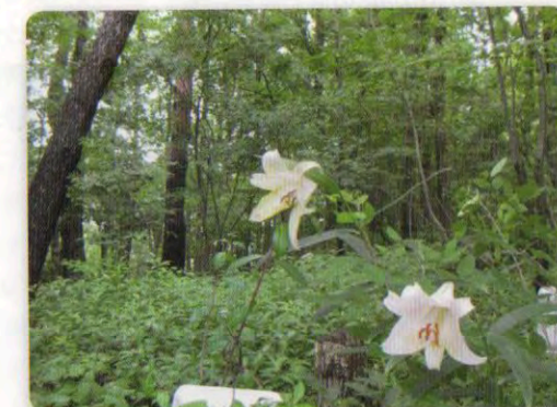
林内に咲くササユリ