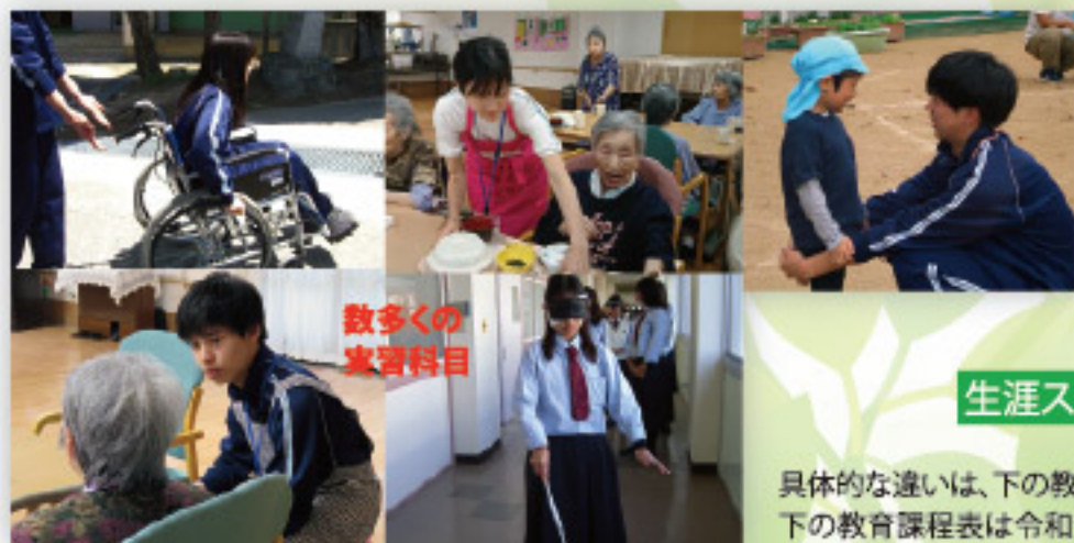
数多くの実習科目