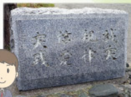
令和元年度実施教育課程 (45~47回生)