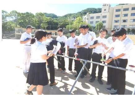
モデルロケット打ち上げ②