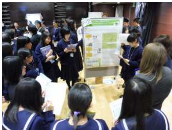
↑ 「植物の成長と音」(神戸高校2年生)