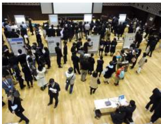
↑ 高校生によるプレゼンテーションの様子