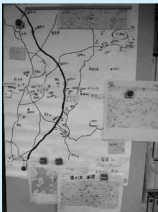
平成 28 年熊本地震時の EARTH 事務局内の様子