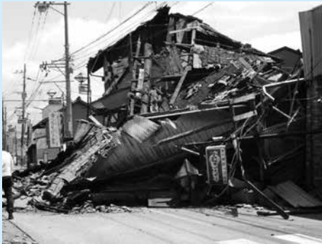
平成 28 年熊本地震で大きな被害を受けた益城町内の様子