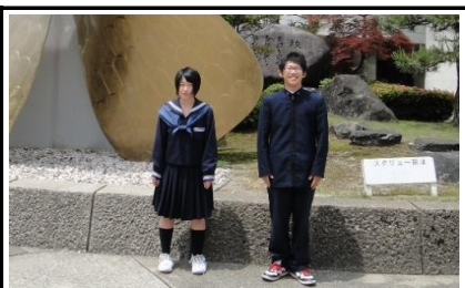
制服紹介 上写真は海洋科学科 普通科は男子詰襟 女子セーラー服