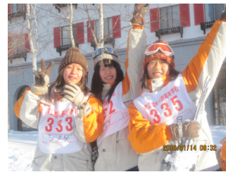
実習2日目出発。この日も晴 れ！予報士二日連続ハズレ