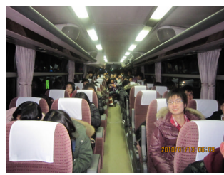
出発は早朝6時、眠い！それ でもバスの中は元気です。

今月13日から16日の 日程で、2年生が北海道 ルスツリゾートへ修学旅 行に行ってきました。心 配されたインフルエンザ には誰も感染せず、天候 にも恵まれ、最高の4日 間を過ごしてきました。 今回は写真を中心に、紹 介したいと思います。