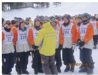
ルスツは晴れ！実習の最初は スクールの先生とご対面から。