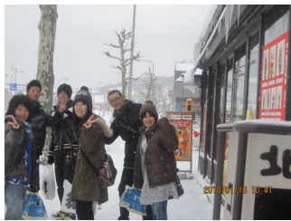
いよいよ最終日、名残惜しい。 小樽はさすがに雪。それでも 遠慮がちに小雪？