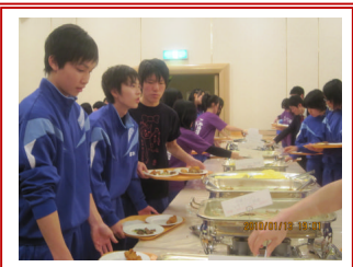
朝夕ともにバイキング、旺 盛な食欲が若さの証明か