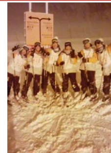
寒波は何処へ？ ナイターもスイスイ！