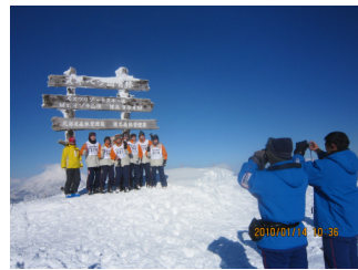
予報士顔負けの快晴！Mt.イヴ 頂上で「ハイ、チーズ」