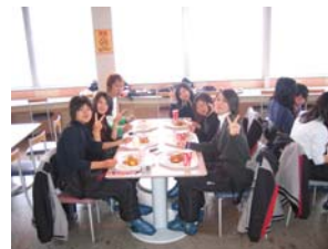
みんなで楽しい食事