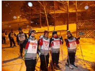
2日目夜のナイタースキー