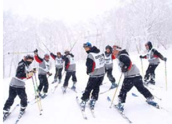
元気な男子の実習班です