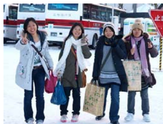
手は土産でいっぱい