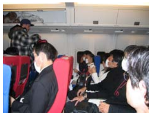
機内にはマスクが……

日が昇る 僕の気持を 引き連れて 自然には 大の字付く こと 納得し 大転倒 それでもスマ イルアイエヌジー 小樽晴れ 運河もいい けど 運もいい 西春の ドラマこれか ら 佳境へと