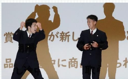
1年次 産業社会と人間 「1年間の取り組み紹介」