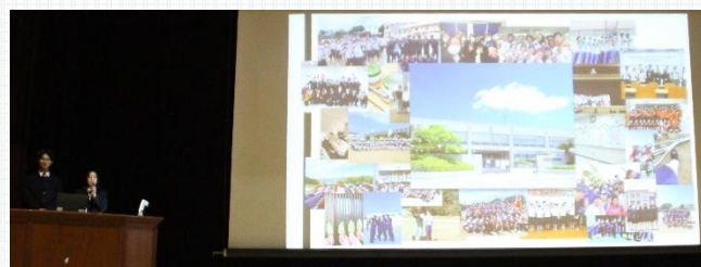
外国人生徒スピーチ 「私たちの加古南ライフ」