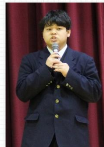
生徒実行委員長 閉会宣言