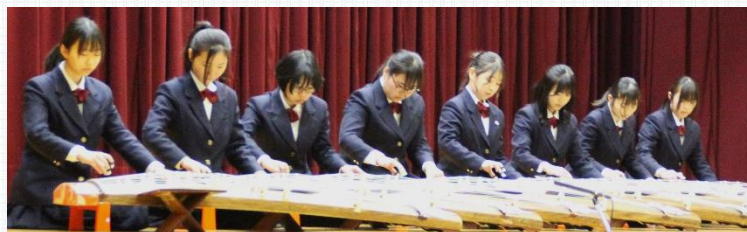
ステージ発表 オープニング 音楽III 箏曲合奏『新松子』 しんちじり