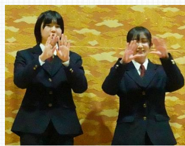
手話I 「手話の理解を深めるために」