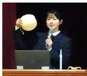
3年次 課題研究 「竹細工が古くから愛されている理由」