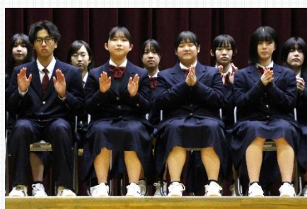
ソルフェージュ 「ボディパーカッション」