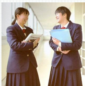
3年次 スピーチ「夢に向かって」