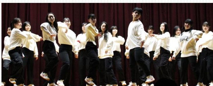
ダンスK 「オリジナルダンスパフォーマンス」