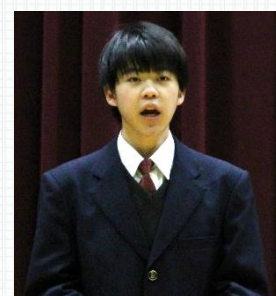
声楽 「テノール独唱」