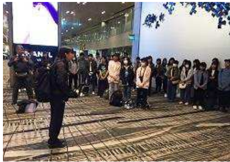
解団式 生徒代表挨拶