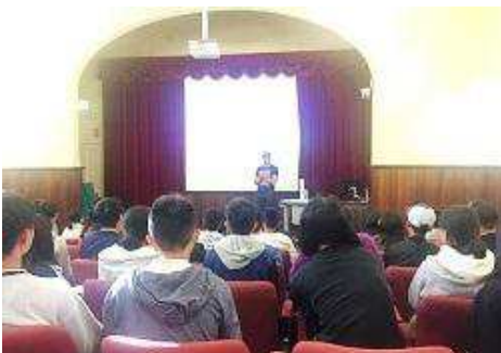
UWAにてオリエンテーション