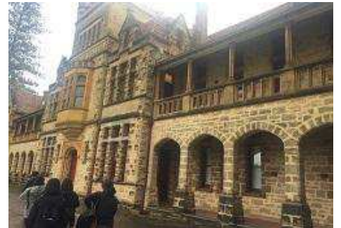
西オーストラリア大学クレアモントキャンパス