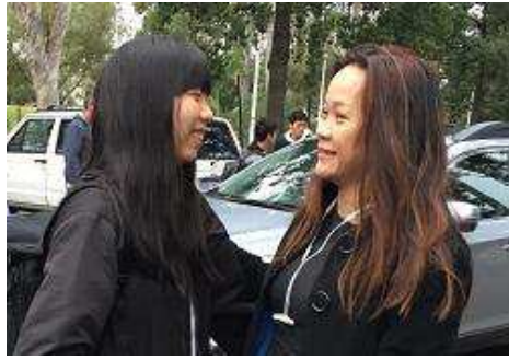
ホストファミリーとの別れ