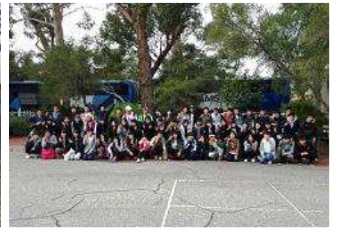
★最終日大学にて集合写真★