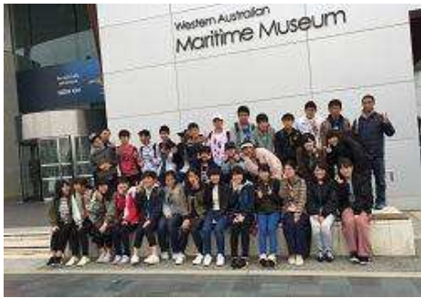
フリーマントル海洋博物館