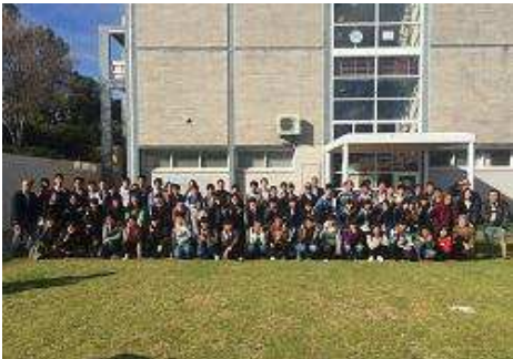
兵庫文化交流センター集合写真