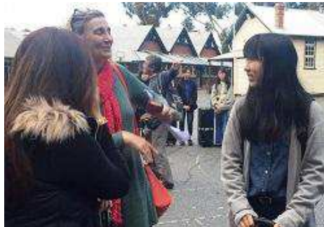
ホストファミリーと対面