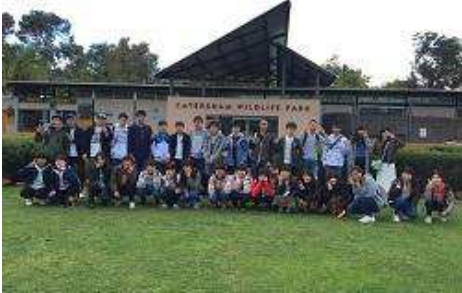
カバシャム・ワイルドライフ・パーク