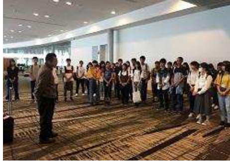
チャンギ空港にて結団式