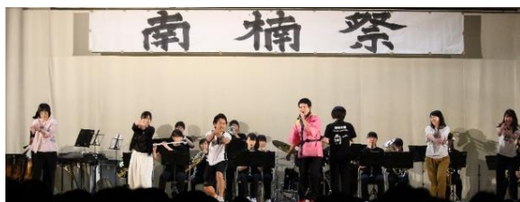
▲ 先生もがんばりました。声援を送ってくれてありがとう！

私たちのクラスは、「平和」をテーマにして、黒板アートや動画の撮影を行いました。クラスで協力して、最後の最後まで頑張ることができました。ほかのクラスの作品の中で一番印象に残っているものは、1組の作品でした。クラスの協力と団結を見ることができました。3年次のステージは、クラスの個性が前面に出ており、とても面白かったです。また、2年次の模擬店では、長い列ができていたクラスもあり驚きました。協力することの大切さを学びました。