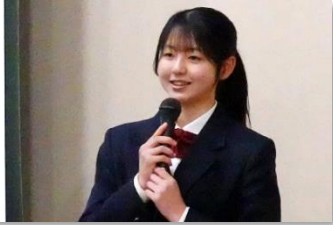
竹細工が古くから愛されている理由