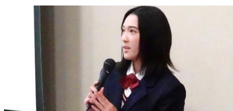
ベジタリアンの世界