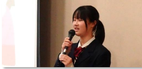
放課後デイサービスの現状とこれから