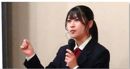
競走馬のセカンドキャリア ～人と馬の共生社会～