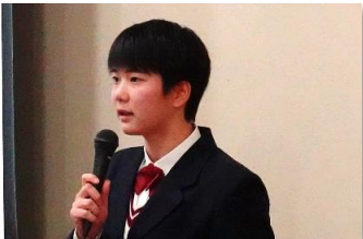
避難の妨げになる認知バイアス