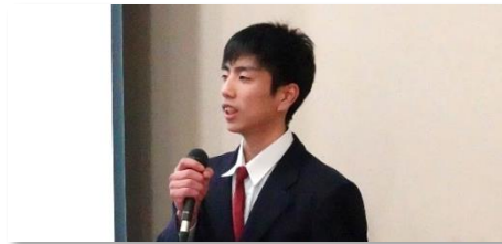
アトピーとアレルギー ～自分に合った対応の仕方～