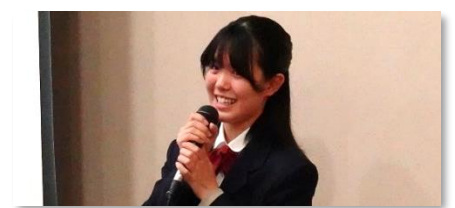
大人も子どもにも愛される絵本の魅力