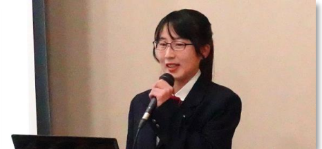
死が人の心を覗くとき ～人が人らしく最期を迎えるには～