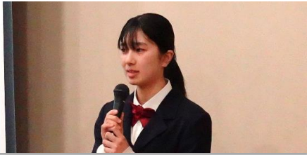
食用花の利用方法