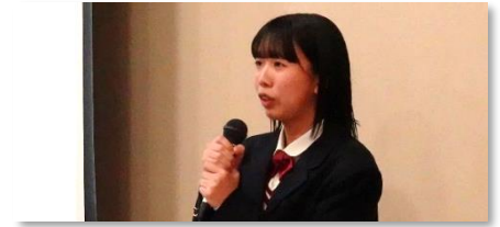
バリアフリーな加古南を実現するには ～加古南生にできることは～