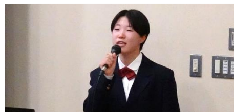
世界に認められ和食の良さ ～もっと和食が食べられるようになるには～