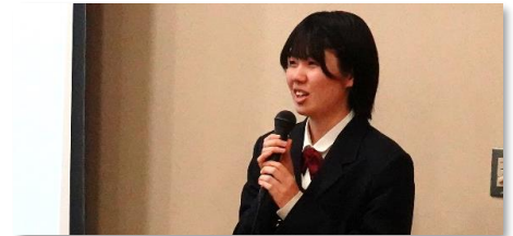
ゲームで「楽しく!」勉強する方法 ～教育における海外と日本の差～