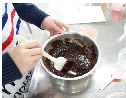
バレンタイン チョコレートケーキ(2月)