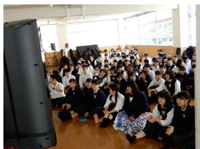
映像鑑賞会（さみどりホール）