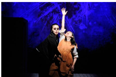
劇団風 「ヘレンケラー」