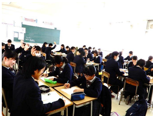
人権 HR (10月26日)