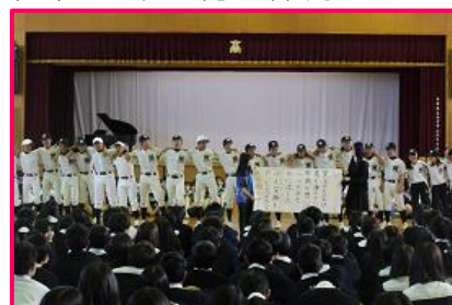
↑ 壮行会での応援練習

総合結果は、敗退と残念な結果となりましたが、校歌披露では、吹奏楽部の演奏で全校生が大きな声で歌い、愛校心を表してくれました。また、メイン種目(女子バスケットボール)の応援では、PTA寄贈のメガホンを手に「チーム甲高」一丸となって声援を送り、高校生らしいさわやかで元気な光景は、感動を与えてくれました。