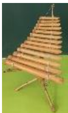
ダン トウロン （竹の楽器）