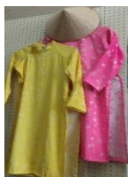
アオザイ （民族衣装）