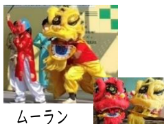
ムーラン （ししまい）