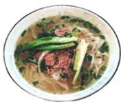
フォー （米粉のめん）