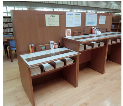
⑥記さい台 「高さがちがうのはなぜ？」