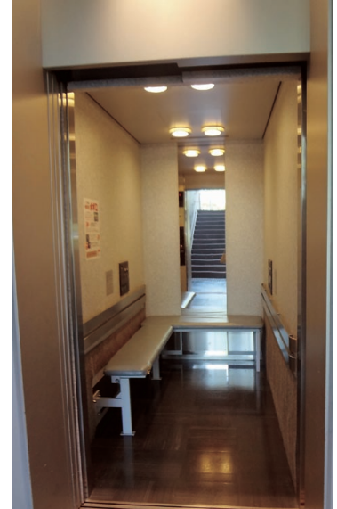
④エレベーター 「どこがちがうの？」