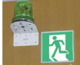
②緑色のランプ 「このランプは何のためにあるの？」