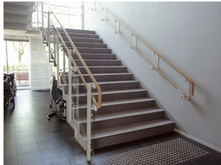
③手すり 「2だんになっているのはなぜ？」