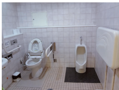
⑧トイレ 「だれにとって使いやすい？」