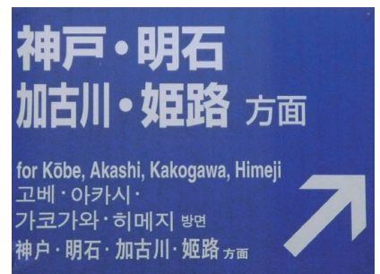
⑨多言語表示 「だれにやさしい？」