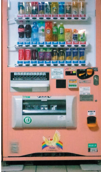
①自動はん売機 「どこがちがうの？」

みのまわりには、みんなのことを考えた「やさしさ」がたくさんあります。 どこに、どんな「やさしさ」があるのか、見つけてみましょう。