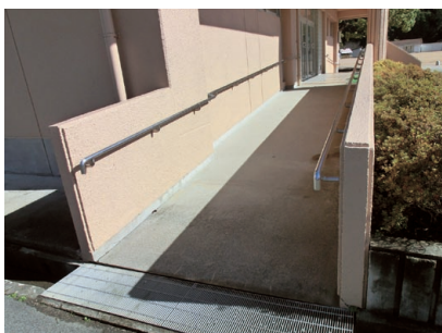
⑦スロープ 「だれにやさしい？」