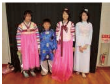
みんな族いしょうでポーズ!