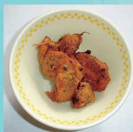
① タンドリーチキン