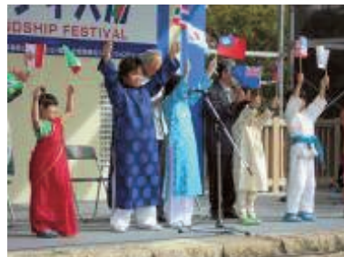
いろいろな国の子どもたちとっしょ