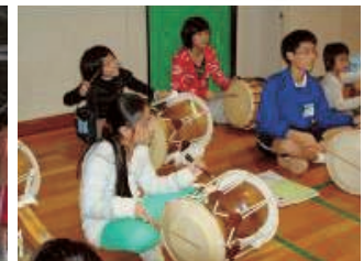
韓国のチャンゴ体けん