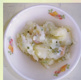
④ ジャーマンポテト