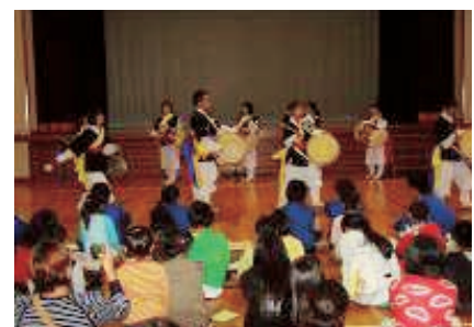
みんなでチャンゴ