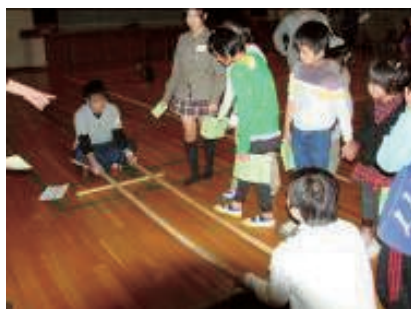
フィリピンのティンクリン