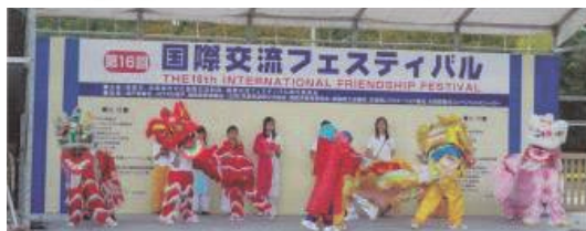
ベトナムのししまいムーラン