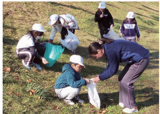
ひめじしりつやわた 姫路市立八幡小学校3年生によるクリーン作せん