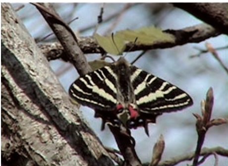
⑥ かこがわ 加古川市 ギフチョウ