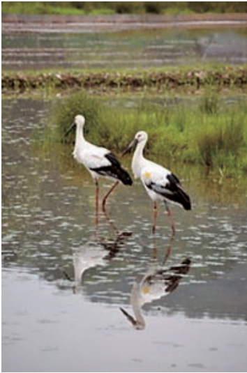
① とよおか 豊岡市 コウノトリ

知っているかな？ ひょうご 兵庫県には、ゆたかで、 うつく 美しい自ぜんがたくさんあり、きちよ うな生き物がたくさんくらしています。