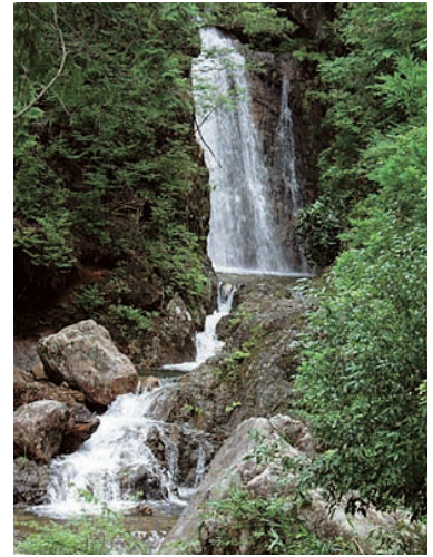
③ たんば 丹波市 ひがおくけいこく 日ヶ奥溪谷