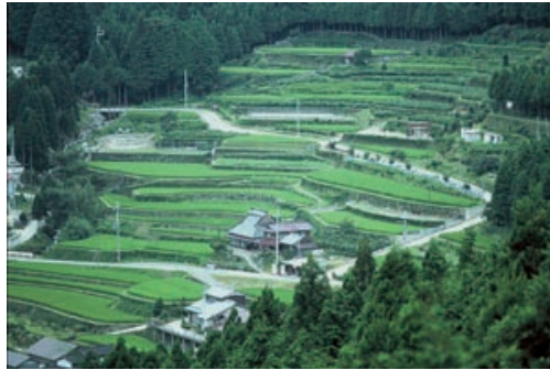
② たか 多可町 たなだ 棚田