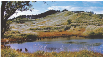
④ かみかわ 神河町 とのみねこうげん 砥峰高原