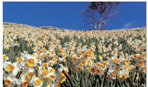
⑦ すいせんきょう 南あわじ市 水仙郷

みなさんの近くにも、草花、 やちよう 野鳥、 ちゅう こん虫など、いろいろな生き物がくらしています。