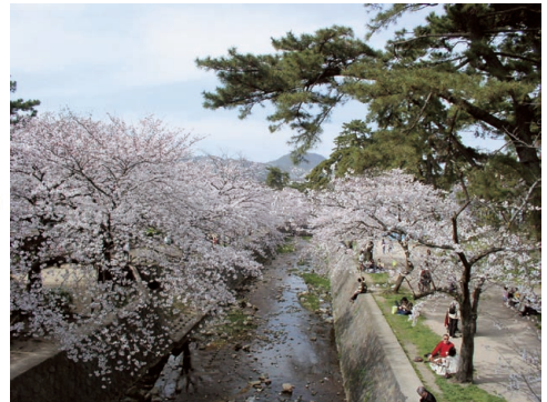
⑤ にしのみや 西宮市 しゆくがわ 夙川の桜