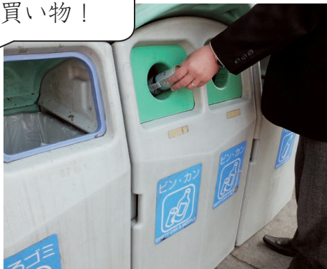
ぶんべつかいしゅう 分別回収ボックス