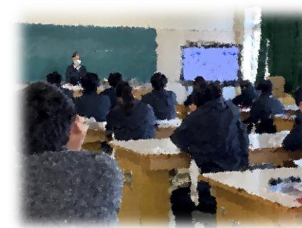
心理学に関する講義の様子