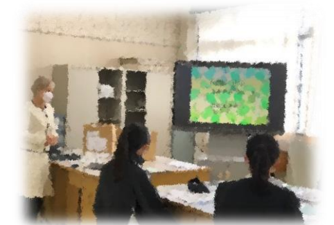
保育・幼児教育に関する講義の様子