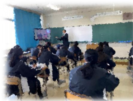
芸術に関する講義の様子

大学や専門学校先生を迎えて、それぞれ教室に分かれて話を聞きました。本校の生徒はさまざまな進路希望を持っていますが、自分に合った道を見つけるきっかけになればいいですね。