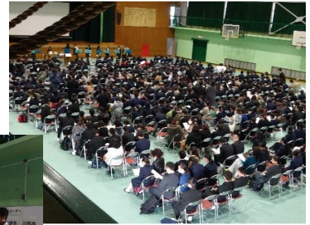
↑ 昨年度オープンハイスクールの様子 ←「先輩と語ろう！」のコーナー