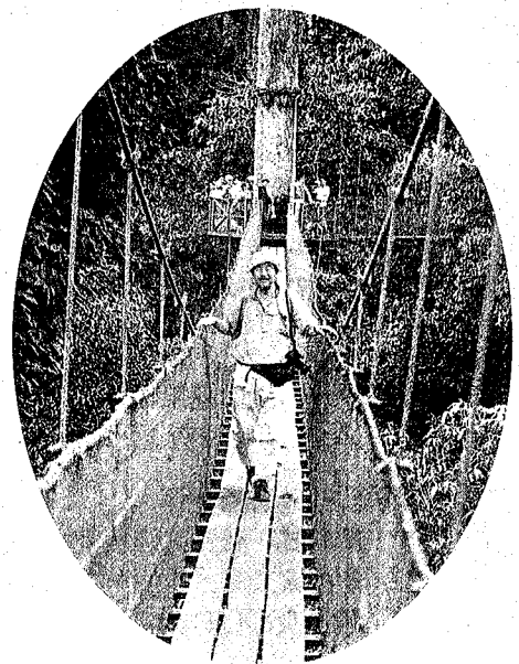
標高約90mのキャノピーウォーク(第3回)

大変欲ばった目的ですが、驚いたことには、わずか8日間のジャングル体験旅行が、じつに有効で、上記の四つの目的を見事に達成することができました。ほとんどの親が、ジャングルスクール体験によって、「子どもが変わった」と言います。「変わった」という