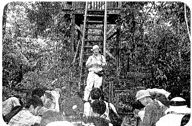
熱帯雨林と生態系についてレクチャー(第3回)