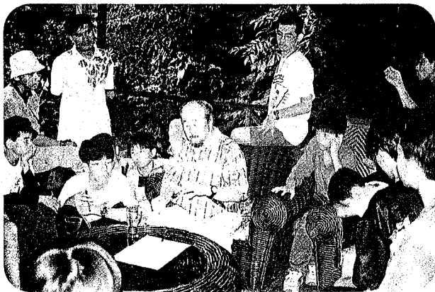
スクール生に囲まれて少年時代を語る(第3回)

ジャングルというと、「ターザン」という言葉がまるで合言葉のように出てくる人が多いのではないのでしょうか。そこは猛獣毒蛇の住処でサソリや毒虫がうようよしており、ぎっしり残った濃密なつたや樹木の壁に阻まれて、歩くこともできない秘境だ、という印象が一般的には強いようです。こんな所へ子どもを連れて行って体験学習をするとは、なんとという無謀な計画だと、当初は批判されました。しかし、これはジャングル(熱帯雨林)に対する誤解から発しており、ジャングルの実態を正確に知り、慎重な計画の下に行くと危険なことはありません。幸