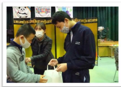
1, 2年生からの心温まる プレゼント

2月26日(金)に3年生を送る会が行われました。中学部での思い出の発表では、楽しかった修学旅行や今年中止になったけれども頑張った運動会や学習発表会、大好きなプールのことなどについて発表しました。思い出のアルバムでは、小さかった時から今までを写真で振り返りました。みんな心も体も大きくなったね。1,2年生は全員が体育館に入ることはできませんでしたが、体育館と教室とのリモート映像でお祝いをしました。当日は冷え込んでいましたが、寒さを吹き飛ばすほどの心温まる会となりました。