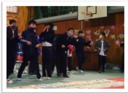
思い出のダンス ♪みんなでわっはっは