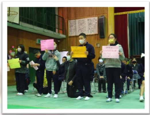
クラスの思い出を語ろう