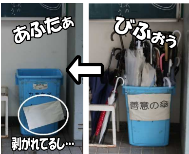
カサBOXの悲しんでいる様子

みんなの笑顔を増やして、『笑顔積み立て』をしていきたいモノです。困ったときには、『笑顔積み立て』から笑顔を分けてもらって!