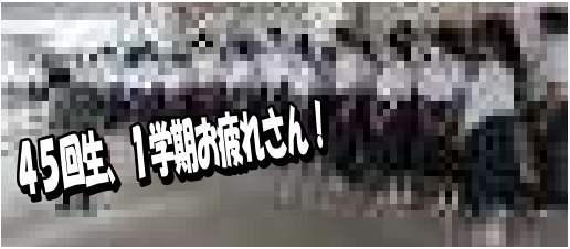
45回生、1学期お疲れさん!

入学式も行えず、入学後即「長期休業」「分散登校」など、未だかつて聞いた事のない単語が飛び交う中での1学期を終えた。伊川谷高校の2学期は8月1日(水)から2学期です。(実感無いなあ)本来あったはずの「行事」がドミノ倒しで中止になる中、よく「ブチブチ」言わずやってくれました。このように、私達学年団の教師も感謝して、早く3者面談が始まります。来週は希望補習もあります。『言われたから頑張る』『自分から頑張る』『この夏、自分という気持ちで頑張る』というスピードで伸びていく。とりあえずは、この夏、自分が『将来何をやりたいのか』を掴む事だね。その為に、