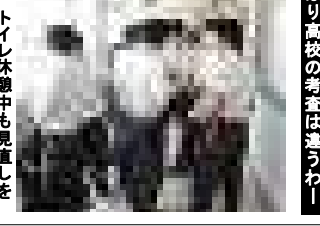
トイレ休憩中も見直しを

中間考査の様に中止になるのか? 期末考査も... いや大丈夫! 期末考査は7月15日(水)21日(火)の5日間で無事行う事ができました。でも、ちよと日程がズレていたから、警報ど真ん中のところでした。ヒヤヒヤしました。最終日は地下鉄遅延で別室受験者9名、試験日はいつも以上に早く登校!でも、 5日間 欠席者ゼロ! これは「糖質ゼロ」より嬉しいです。2学期もこの調子でやってみよう!という事は、答案が返ってきたら、試験は返ってきたら答えは? スダサー 返却時、速くから「ダースベイダーのテーマ」が聴こえてきた人も居る様です。「ダメだつ、暗黒面に落ちてはいけない!」そんな危険な点数を取ってしまった人は、必ず2学期に挽回してください。